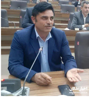
رئیس شبکه بهداشت و درمان ملکان خبر داد:

دعوت کرد و افزود: با عنایت به عدم قطع مصارف خانگی ضروری است سازمان های دولتی نسبت به کاهش مصرف و کم کردن دور کولرهای خود و خاموش کردن کولرهای غیرضروری خود اقدام نمایند. وی ادارات دولتی را به کاهش حداقل ۳۰ درصد مصرف برق دعوت کرد و در عین حال گفت: برق ادارات و سازمان ها و بانک هایی که الگوی مصرف را رعایت نکنند قطع خواهد شد.