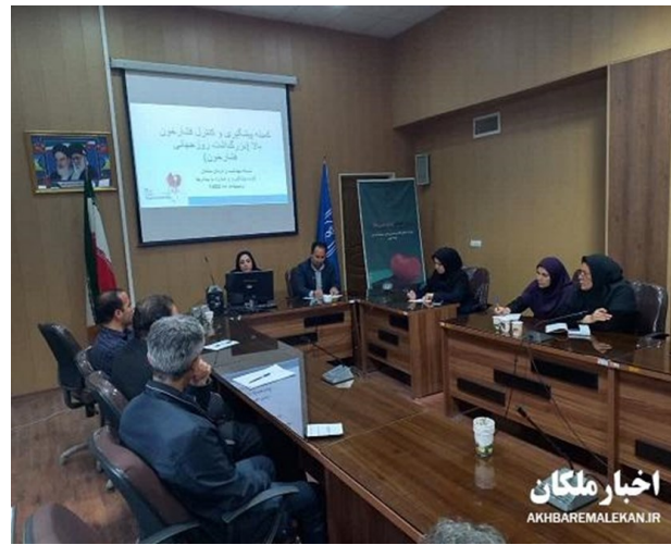
رئیس شبکه بهداشت و درمان ملکان خبر داد:

فشار خون بالا مهمترین عامل مرگ در بیماریهای قلبی و عروقی است. فشار خون بالا مهمترین عامل مرگ در بیماریهای قلبی و عروقی استرئیس شبکه بهداشت و درمان ملکان در این جلسه با اشاره به نقش بیماریهای غیرواگیر در افزایش مرگ و میرها اظهار داشت: ۴۵ درصد مرگ و میرها بعلت بیماری های قلبی و عروقی بوده و متأسفانه در این بین فشار خون بالا نیز مهمترین علت فوت در این بیماری ها می باشد.